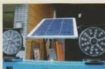
50Wのソーラーパネル使用、無日照約12日間。