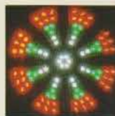
夜間は赤・緑・白が光ります。