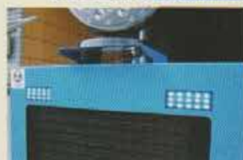
青LEDで視認性の高いプリンカー。